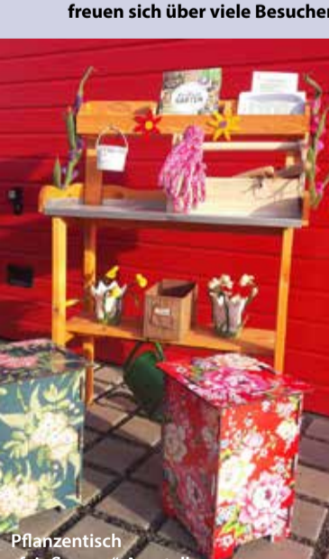
Pflanzentisch „fair flowers“-Ausstellung

Die Öffnungszeiten entnehmen bitte den Webseiten der jeweiligen Ausstellungsorte.