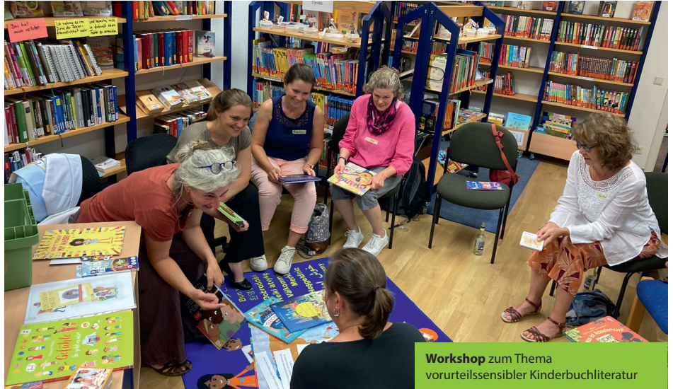
Workshop zum Thema vorurteilssensibler Kinderbuchliteratur