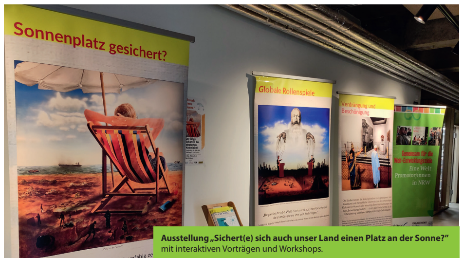
Ausstellung „Sichert(e) sich auch unser Land einen Platz an der Sonne?“ mit interaktiven Vorträgen und Workshops.