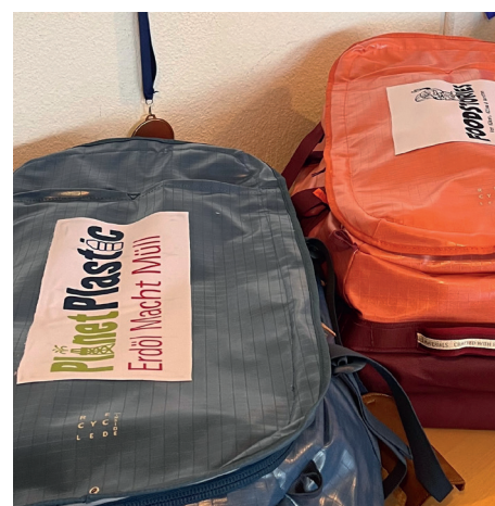
Unsere aktualisierten Bildungsmaterialien