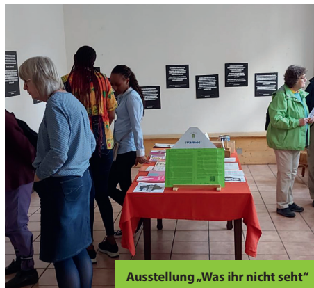
Ausstellung „Was ihr nicht seht“