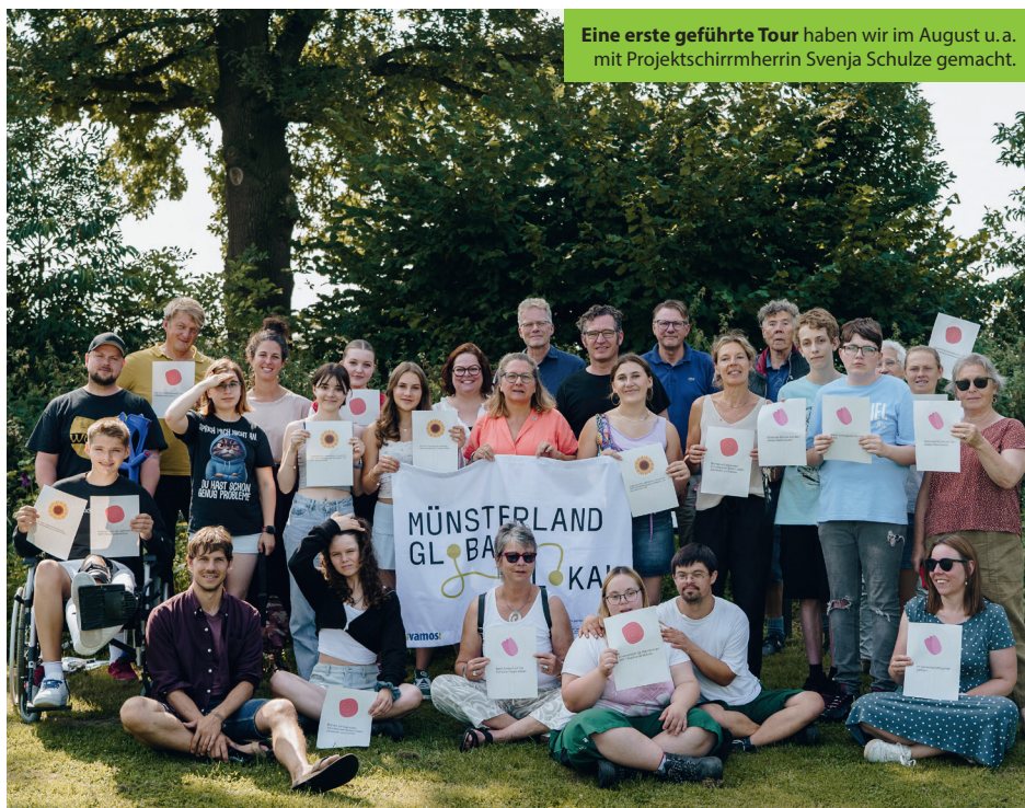
Eine erste geführte Tour haben wir im August u. a. mit Projektschirmherrin Svenja Schulze gemacht.