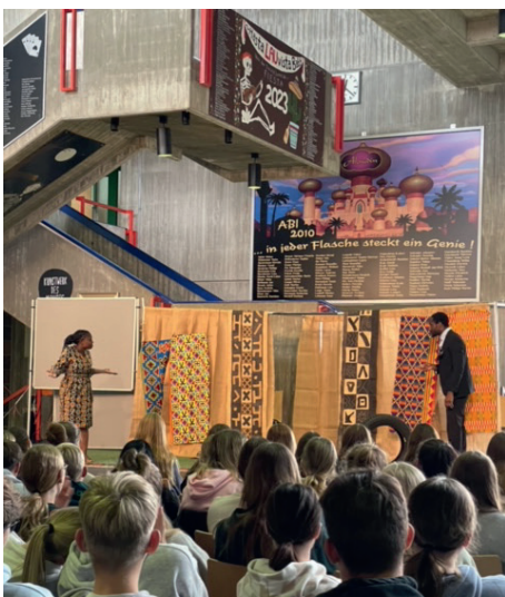
Theaterstück „Be-Longing“ vom Cactus Theater und Gespräch mit den Schüler:innen

Bei Fragen und Anregungen zur Arbeit der Promotor:innen bitte E-Mail an neumann@vamos-muenster.de