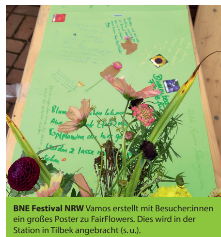
BNE Festival NRW Vamos erstellt mit Besucher:innen ein großes Poster zu FairFlowers. Dies wird in der Station in Tilbek angebracht (s. u.).