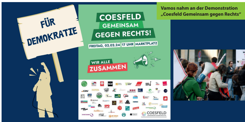
Vamos nahm an der Demonstration „Coesfeld Gemeinsam gegen Rechts“

Auch in diesem Jahr unterstützte Vamos lokale Gemeinschaften, förderte weiter Austausch und Engagement und thematisierte globale Ungerechtigkeiten. Highlights waren ein Vernetzungstreffen der Fairtrade-Steuerungsgruppen im Münsterland, die Teilnahme an Veranstaltungen wie dem Coesfelder Nachhaltigkeitsmarkt, der Ehrenamtsmesse in Warendorf und der Demonstration „Coesfeld gemeinsam gegen Rechts“ sowie die Mitarbeit in BNE-Netzwerken, dem Coesfelder Klimapakt und in Gremien der Stadt Münster.