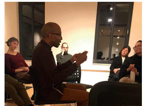
„Ich gehe immer leise“ mit Fishbowlgespräch zum Thema Rassismuskritik.