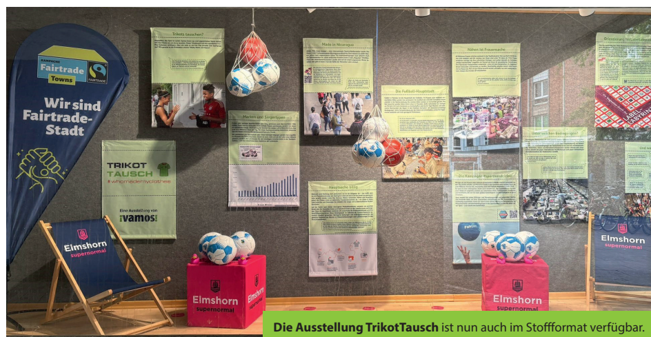
Die Ausstellung TrikotTausch ist nun auch im Stoffformat verfügbar.