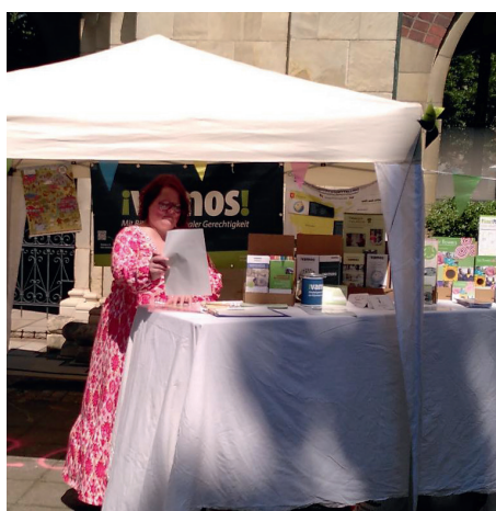
Nachhaltigkeitsmarkt in Coesfeld Wir nehmen mit dem Vamos-Infostand teil.